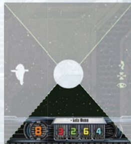
Добавочный сектор обстрела Бобы Фетта

Атакуя вспомогательным оружием, вы должны выбрать целью атаки корабль, находящийся в стандартном секторе обстрела (если на карте улучшения не указано иное).