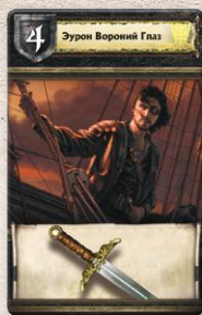
Карта Дома Грейджой

Атакующий и защитник втайне друг от друга выбирают по одной карте Дома с руки. Когда оба сделали свой выбор, выбранные карты одновременно раскрываются. Свойства карт, если таковые есть, вступают в силу.