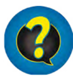
«Не в тему»