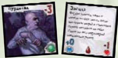
Параметры движения Боевые свойства

Жетоны монстров изображают чудищ, вышедших на улицы Аркхэма. Лицевая сторона жетона помогает сыщикам понять, как и когда движется соперник, обратная – каков он в бою. Когда монстр просто идет по улицам Аркхэма, его жетон лежит лицом (картинкой) вверх; в начале боя жетон переворачивают вверх стороной с текстом. Игроки могут осмотреть жетон монстра с любой стороны тогда, когда посчитают нужным. На стр. 21 вы найдете схему «Жетон монстра».