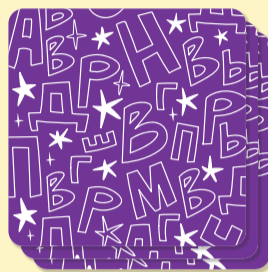
Продвинутый уровень: слова из 5–7 букв