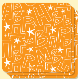
Базовый уровень: слова из 3–4 букв

В игре два уровня сложности. Оранжевые карты с короткими словами подходят для ребят, которые ещё учатся читать. Малыши закрепляют образ буквы и учатся самостоятельно составлять слова. Фиолетовые карты подходят для детей, которые уже умеют читать. С ними ребята развивают скорочтение, словарный запас и улучшают скорость реакции.