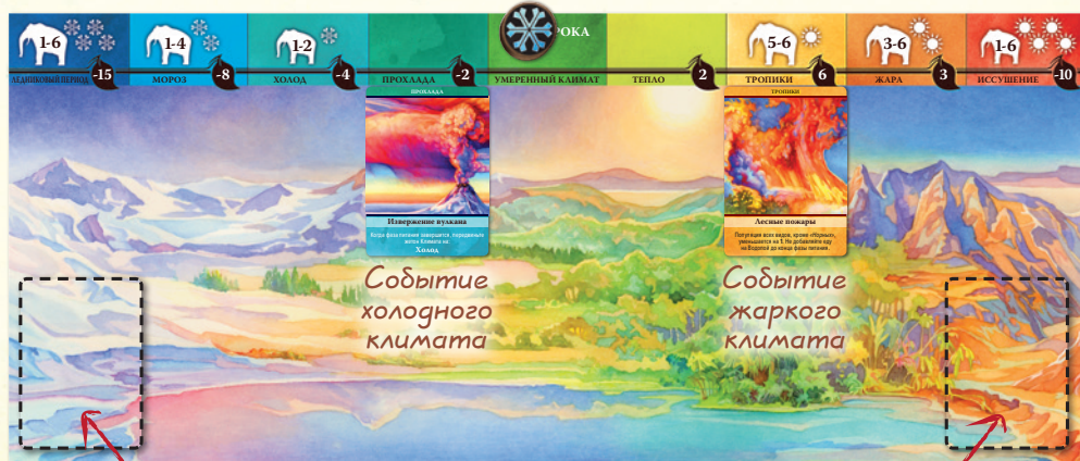
Колода холодного климата